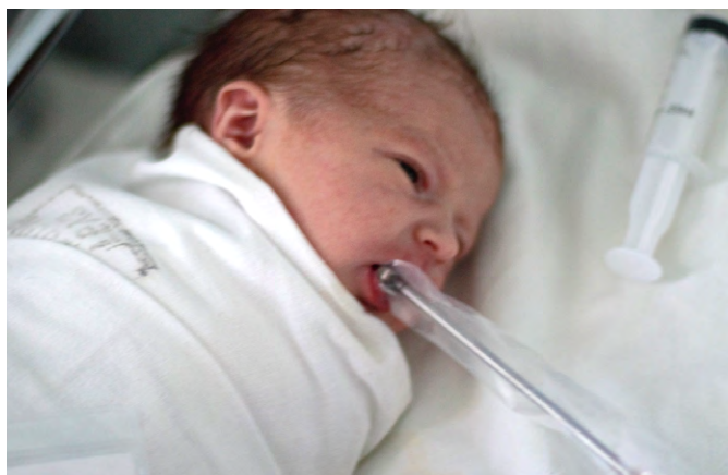
Рис. 3. Определение силы мышц языка у новорожденных Fig. 3. Determining tongue muscle strength in newborns

использовать как у взрослых пациентов (рис. 2), так и у детей, в том числе у новорожденных (рис. 3). Изобретение поможет в перспективных исследованиях, направленных на понимание механизмов давления мышц языка и губ у пациентов с врожденными пороками лица и зубочелюстно-лицевыми аномалиями (патент № 212978) [21, 22].