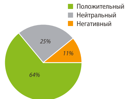
Рис. 3. Субъективная оценка эффективности применения зубной пасты R.O.C.S. PRO Moisturizing в течение 1 месяца на фоне ксеростомии [Fig. 3. Subjective assessment of the effectiveness of R.O.C.S. PRO Moisturizing toothpaste for 1 month due to xerostomia]

из-за отсутствия в широкой продаже. В связи с этим внедрение в клиническую практику доступных по цене и наличию в аптечных сетях отечественных препаратов-аналогов имеет большое значение для стоматологической реабилитации группы пациентов с ксеростомией. Разработанная ООО «Диарси» увлажняющая зубная паста позволяет оптимизировать лечение сухости в полости рта, по сравнению с известными на сегодняшний день аналогами.