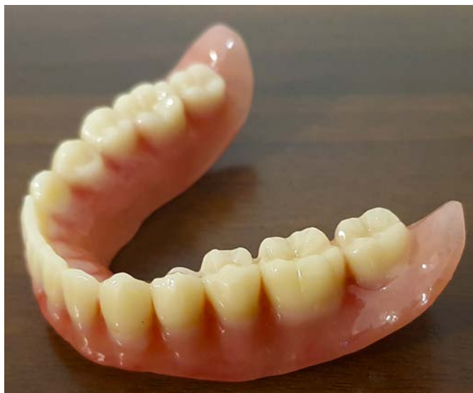
Рис. 2. Фрезерованный протез