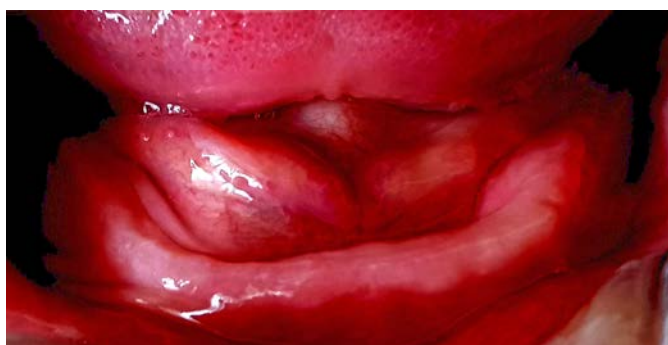
Рис. 1. Контактный протезный стоматит

Предварительный протез по технологии безвоскового моделирования полностью соответствует будущему постоянному фрезерованному протезу, использование