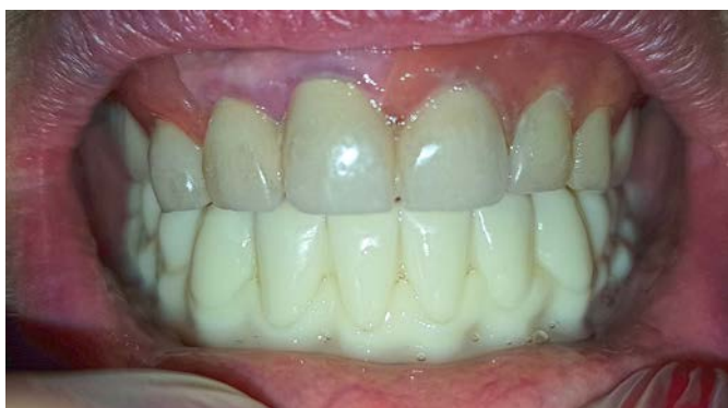
Рис. 6. Примерка прототипированного протеза