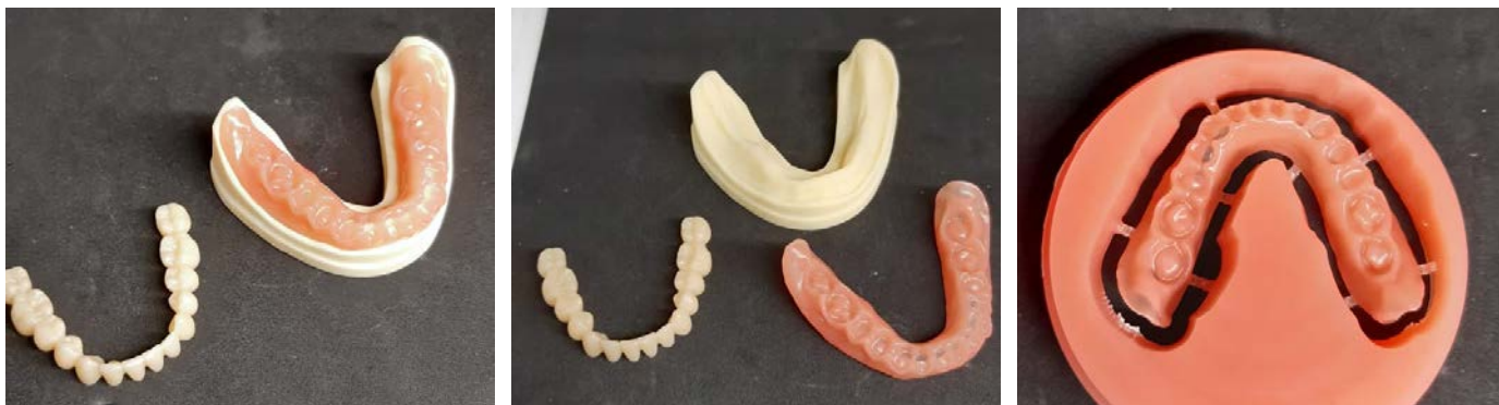
Рис. 4. Фрезерованные фрагменты будущего протеза

быстрого компьютерного прототипирования позволяет всем сторонам оценить критерии успеха до выпуска готовой конструкции, обеспечивая контроль за результатом (рис. 6) [16, 17].