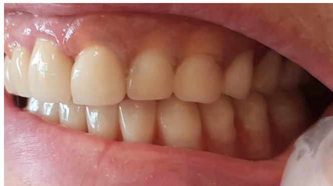
Рис. 3. Фрезерованный протез в полости рта