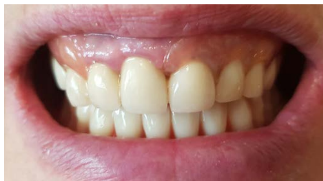
Рис. 7. Полный съемный фрезерованный протез в полости рта