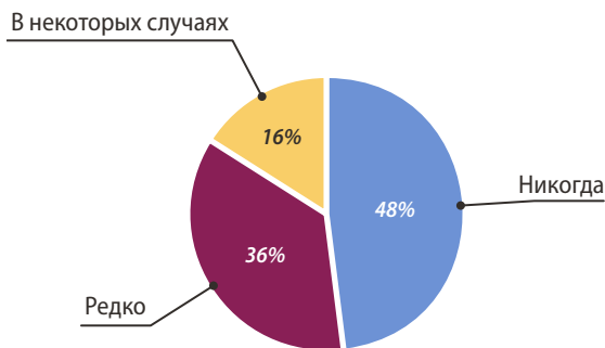
Рис. 3. Оценка внимания окружающих при ношении эпитезов с моделированием цвета кожи с помощью спектрометра Fig. 3. Assessing the attention of others when applying epitheses with skin color modeling using colorimeter

Соответствующий рецепт красителя из базы данных отображался на экране прибора. Добавляя пигменты различных оттенков придавали будущей конструкции определенную цветовую гамму. После примерки ранее полученную цветовую гамму конструкции дополняли специальными внешними красителями для имитации родимых пятен, невусов, локальных покраснений,