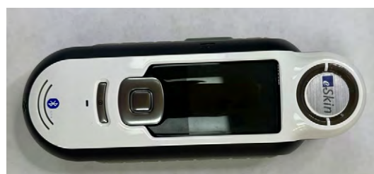
Рис. 1. Прибор для определения цвета Capsure RM200 (X-Rite, США) Fig. 1. X-Rite Pantone Capsure RM-200 colorimeter

Косметическая составляющая подразумевала биомиметическую обработку, для которой использовался силикон с палитрой цветовых пигментов и искусственно окрашенные волокна, симулирующие сосуды и структурные элементы кожи. Цвет кожи на здоровом участке лица был оцифрован с использованием портативного колориметра Capsure RM200 (X-Rite, США; рис. 1).